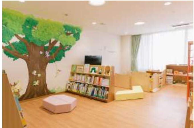
完成したマニュアルわくわくる一む

大阪急性期・総合医療センターの「わくわくる一む」は、ガラス張りとなっており、室内の楽しい様子が廊下から見えるように設計されています。入口の床とドアの上部には癒しの森を象徴する緑色を用いることで、緊張しがちな病院の中でほっと安心できる空間を演出しています。