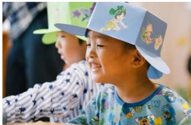
マニユライフわくわくる一むで遊ぶ子どもたち