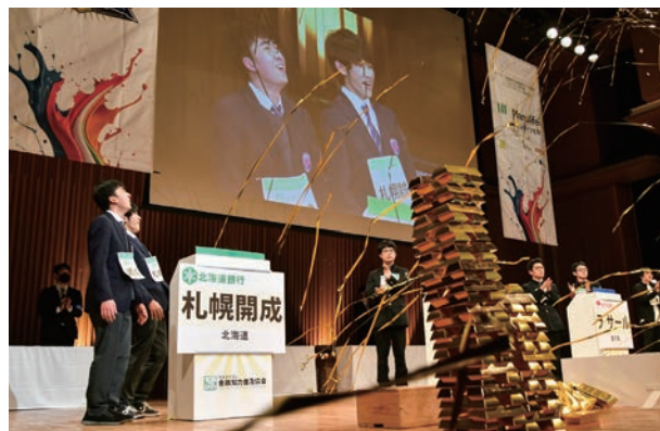
第17回エコノミクス甲子園 全国大会の様子

人生100年時代を担う若い世代にとって、正しい金融知識を身につけることの重要性が増しています。「エコノミクス甲子園」は、高校生が金融・経済システムを理解し、自分の人生をデザインする力と、金融・経済に関する知識を身につけることを目的としたもので、2006年より開催されています。マニライフ生命は社会貢献活動の一環として、2015年の第9回大会以来協賛しています。2023年2月に行われた第17回大会では、354校805チームが参加した地方大会を勝ち進んだ44校88名が熱い闘いを繰り広げ、優勝チームには優勝トロフィーと副賞のニューヨーク・ボストン研修旅行が贈られました。